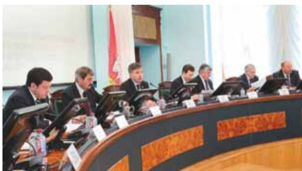
Годовое общее собрание ПРОМАСС апрель 2011