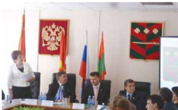
Совместное заседание с Ассоциацией муниципальных образований "Содружество" Троицк, март 2011