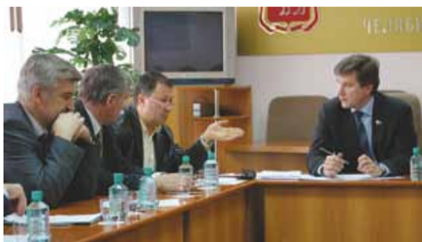
Оперативное совещание по сохранению трудовых коллективов предприятий области декабрь 2009