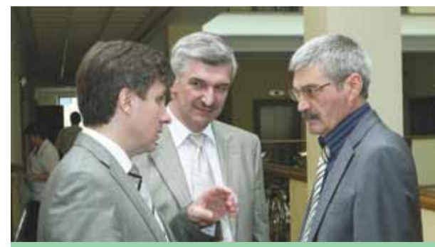
Работа в составе антикризисного штаба Челябинской области июнь 2010