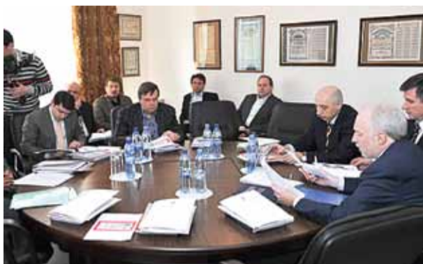
Заседание координационного совета объединений РСПП УрФО февраль 2012