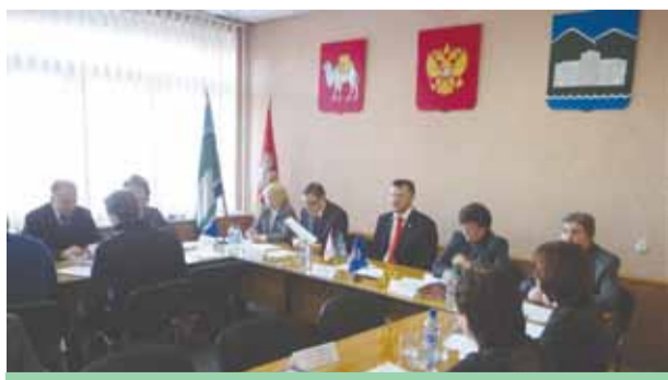
Выездное заседание отраслевой комиссии в г.Карабаш январь 2011