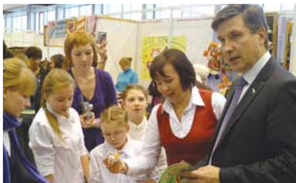
На выставке, организованной НП "Союз женщин – предпринимателей Челябинской области "Союз успеха" декабрь 2010