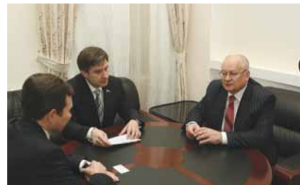
Визит вице-президента РСПП Виктора Черепова апрель 2010