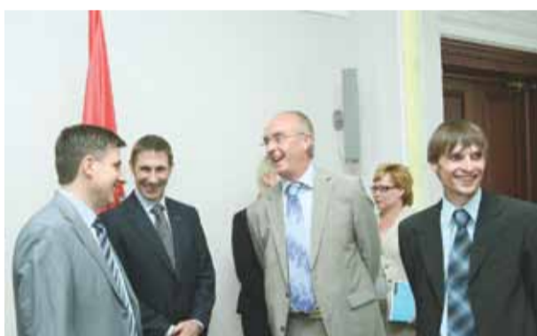
Визит Президента Группы компаний ROCKWOOL Элко ван Хила июнь 2010