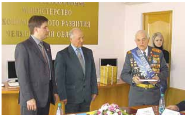
Подписание соглашения о партнерстве с областным Советом ветеранов февраль 2006