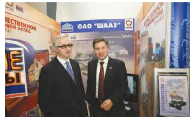
На выставке "Индустрия Урала" Тюмень, май 2009