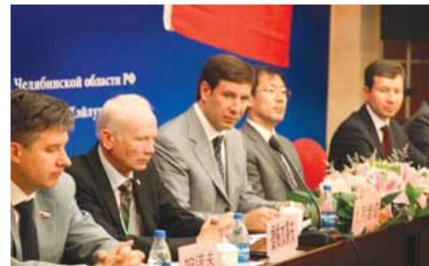
Поездка официальной делегации во главе с губернатором Челябинской области в Китай июнь 2011