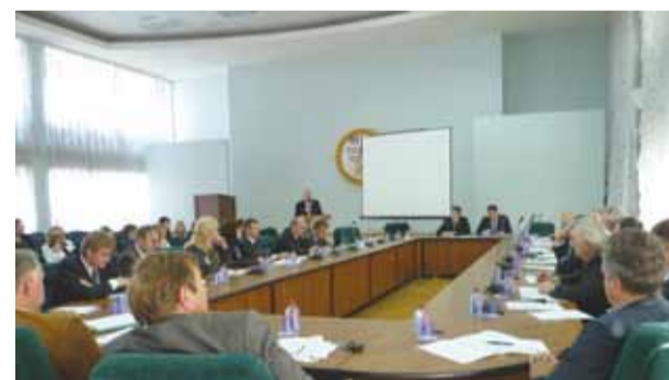
Заседание Правления ПРОМАСС 2011